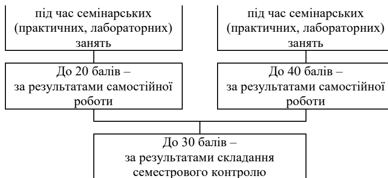
Рис. 2.1. Схема нарахування балів студентам за результатами навчання

2.2. Обсяг балів, здобутих студентом під час лекцій з навчальної дисципліни, обчислюється у пропорційному співвідношенні кількості відвіданих лекцій і кількості лекцій, передбачених навчальним планом, і визначається згідно з додатками 1 і 2 до Положення про організацію освітнього процесу в Хмельницькому університеті управління та права імені Леоніда Юзькова.